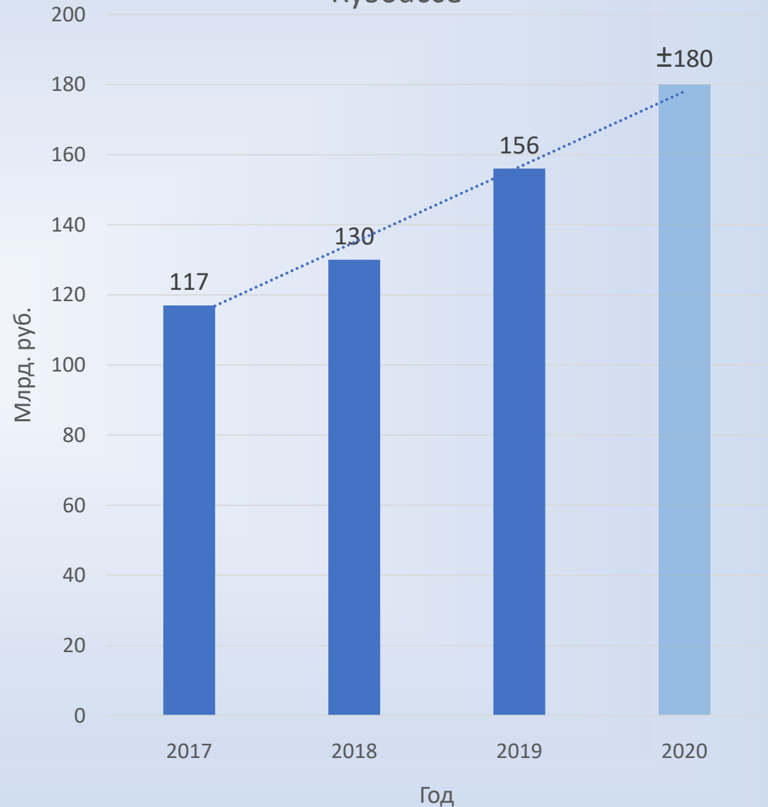
Объем рынка строительных работ в Кузбассе

На фоне активного строительства в г. Кемерово увеличился спрос на прокладку коммунальных сетей. Объемы работ ООО «РСУ СКЭК» возросли в 3-4 раза.