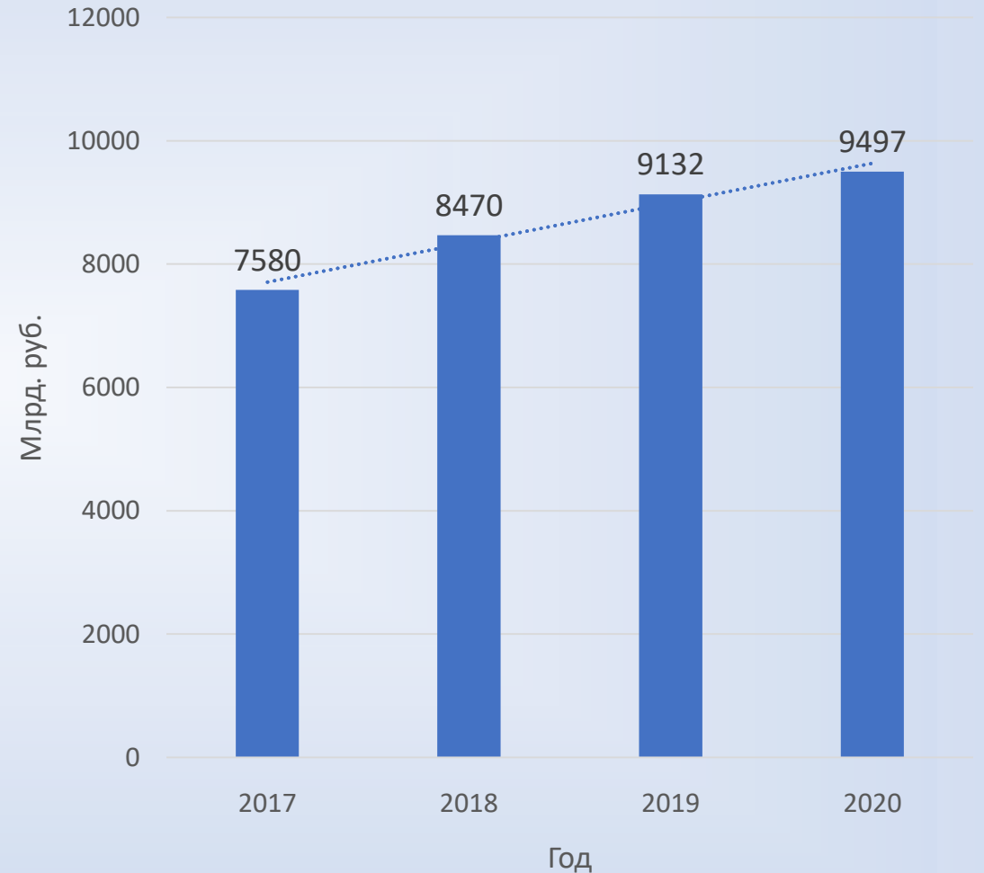
Объем рынка строительных работ в России

Основными источниками финансирования являются частный капитал и государственные программы. Именно на них стоит ориентироваться при долгосрочном планировании.