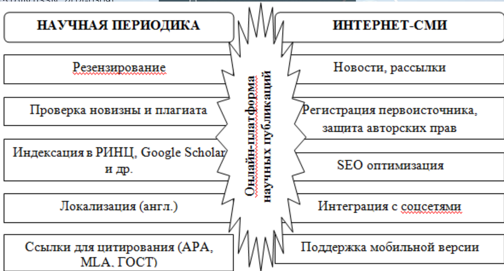
Рисунок 12 – Функциональная схема научных журналов АНО «Центр «Полилогос» с учётом функции интернет-СМИ

Научно-периодическое электронное издание