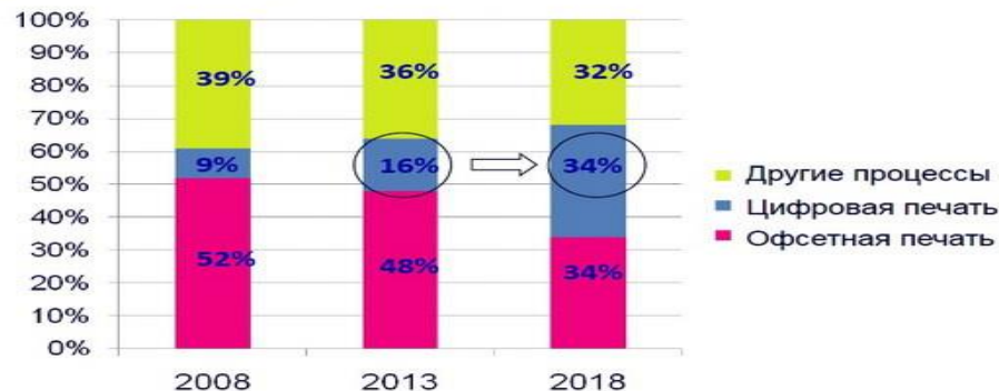
Доли рынка по печатным процессам, в зависимости от дохода, во всем мире, 2008-2018 г.г. (%)

В связи с падением среднего объема тиража, падает доля рынка традиционной офсетной печати. За счет этого и за счет цифровизации оборудования растут объемы цифровой печати.